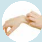
アトピー・敏感肌に