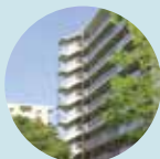
マンション・アパートに